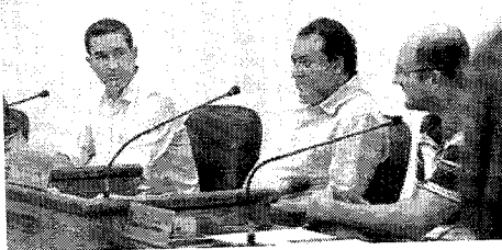
ESTRELA: sessões ocorrem nas segundas-feiras, às 18h30min

O Sup Festival Estrela abraçará a primeira etapa da Copa União de Stand Up Paddle, um circuito aberto a atletas de todo o Brasil, organizado por